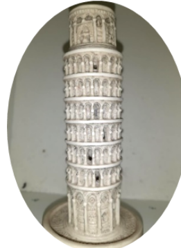
Tour de Pise (Italie)