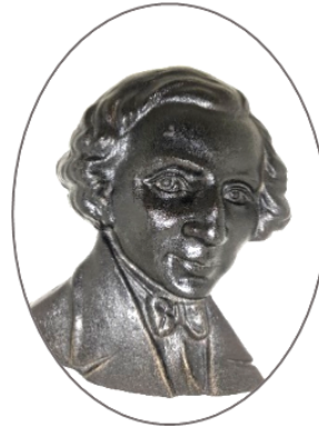
Frédéric Chopin, compositeur (Pologne)