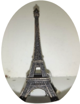
Tour Eiffel (France)